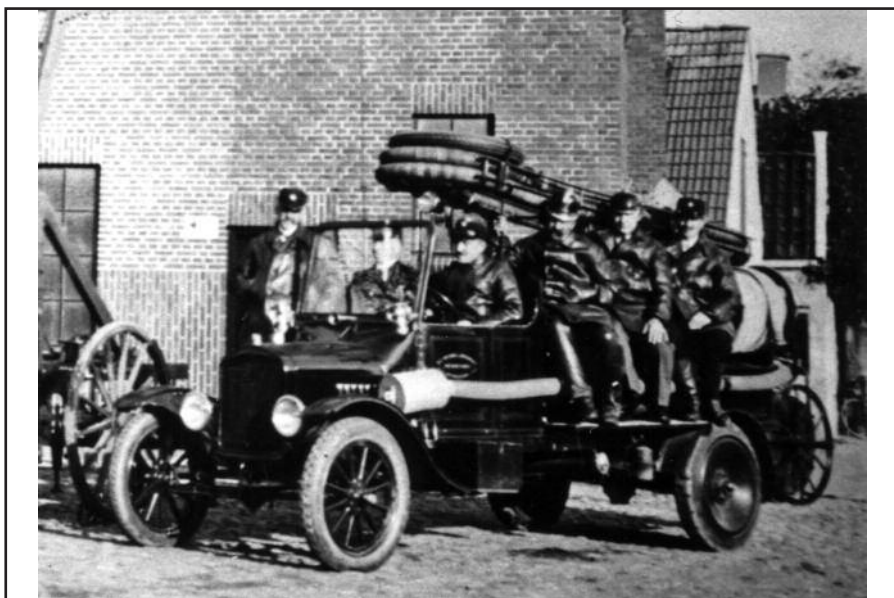
De 'Borgaspuit' van de gemeente Appingedam.